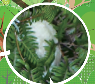
モリアオガエルのたまご(5月下旬)